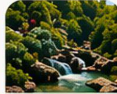
DİMÇAYI VADİSİ Dimçayı Valley