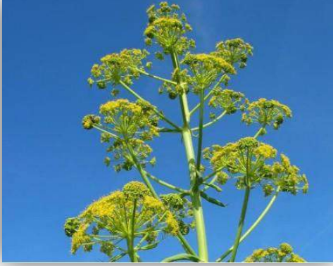
Çakşır Otu Ferula