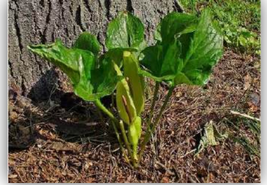
Yılan Yatağı Arum italicum

Alanya'ya ait Endemik Bitki türlerinin yer aldığı "Alanya Herbarium Müzesinde" Alanya Kalesi'nden toplanmış olan 115 adet bitki türü mevcuttur. Bilimsel kaynaklardan alınan bilgilere göre bunlardan 8 tanesi sadece kale bölgesinde yetiştiği için endemik türlerimizdendir. En özel 3 endemik türümüz Yılan Yastığı, Peygamber Çiçeği ve Çakşır Otu'dur.