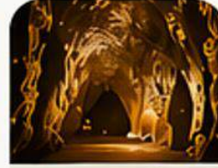
DAMLATAŞ MAĞARASI Damlatas Cave