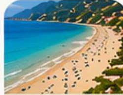
KLEOPATRA PLAJI Kleopatra Beach