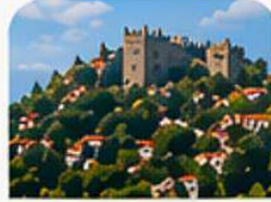
ALANYA KALESİ Alanya Castle

Fotoğraf çekerken özel mülklere veya izinsiz alanlara girmeyin.