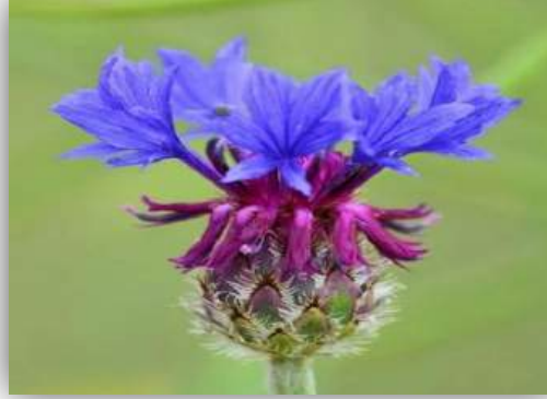
Peygamber Çiçeği Centaurea kilaea